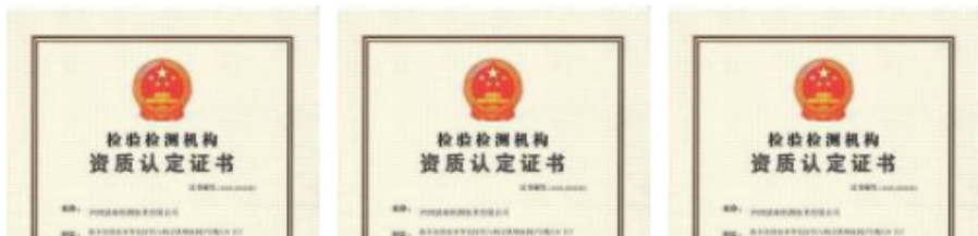
山东派森食品有限公司年产 菏泽舜阳水产科技有限公司 曹县六艺包装厂年产200万个